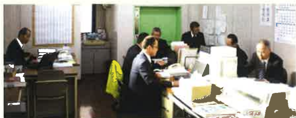
社長が率先垂範の営業室

ファイナンシャルプランナー（2級）、住宅ローンアドバイザー、相続士、損害保険募集人資格、生命保険募集人資格、防火管理者です。