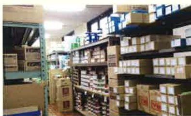
倉庫には在庫品常備

（現金が入用なのか、節税なのか、相続なのか、本業での悩み、等） そして解決ができる、ご提案をすること。