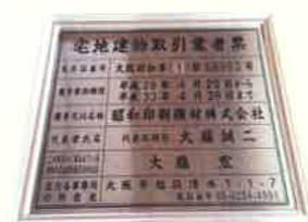
真新しい宅建の標識

本業である印刷製本業、また不動産のことをご提案させていただき、企業が永続発展するためのお手伝いをいたします。お気軽に声をかけてくださいますように、今後ともよろしく願っています。